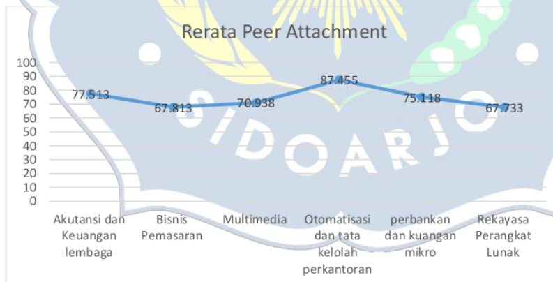
Grafik Rerata Peer Attachment

Hasil analisis menunjukkan bahwa terdapat perbedaan peer attachment dilihat dari jurusan dengan nilai F = 5.668 dan sig. (0.001) < 0.05.